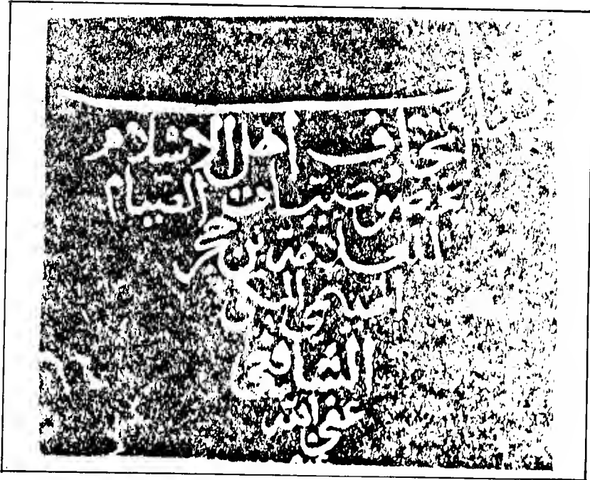
ورقة الغلاف من النسخة (ب)